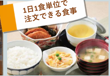
イメージ（ダイニング）